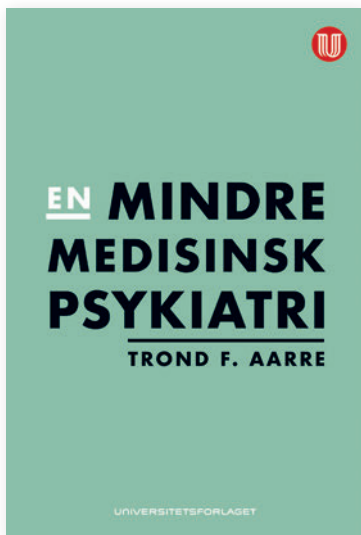
TROND AARRE En mindre medisinsk psykiatri , 2018, Universitetsforlaget, 200 sider