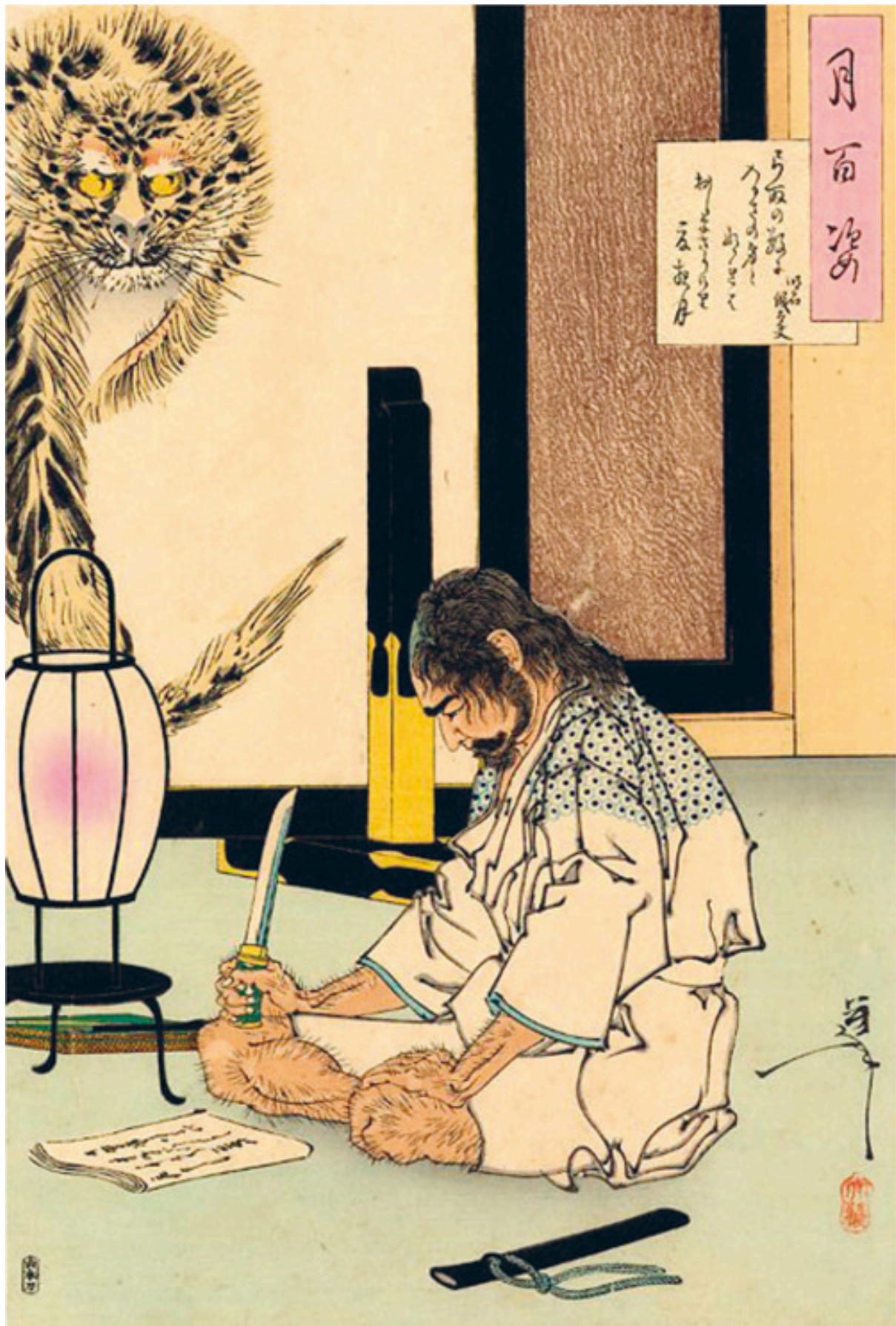
SEPPUKU: Den japanske generalen Akashi Gidayu forbereder seg til rituelt selvmord, seppuku, etter et militært nederlag i 1852. Han har akkurat skrevet et dødsdikt. Av Yoshitoshi Tsukioka, rundt 1890.