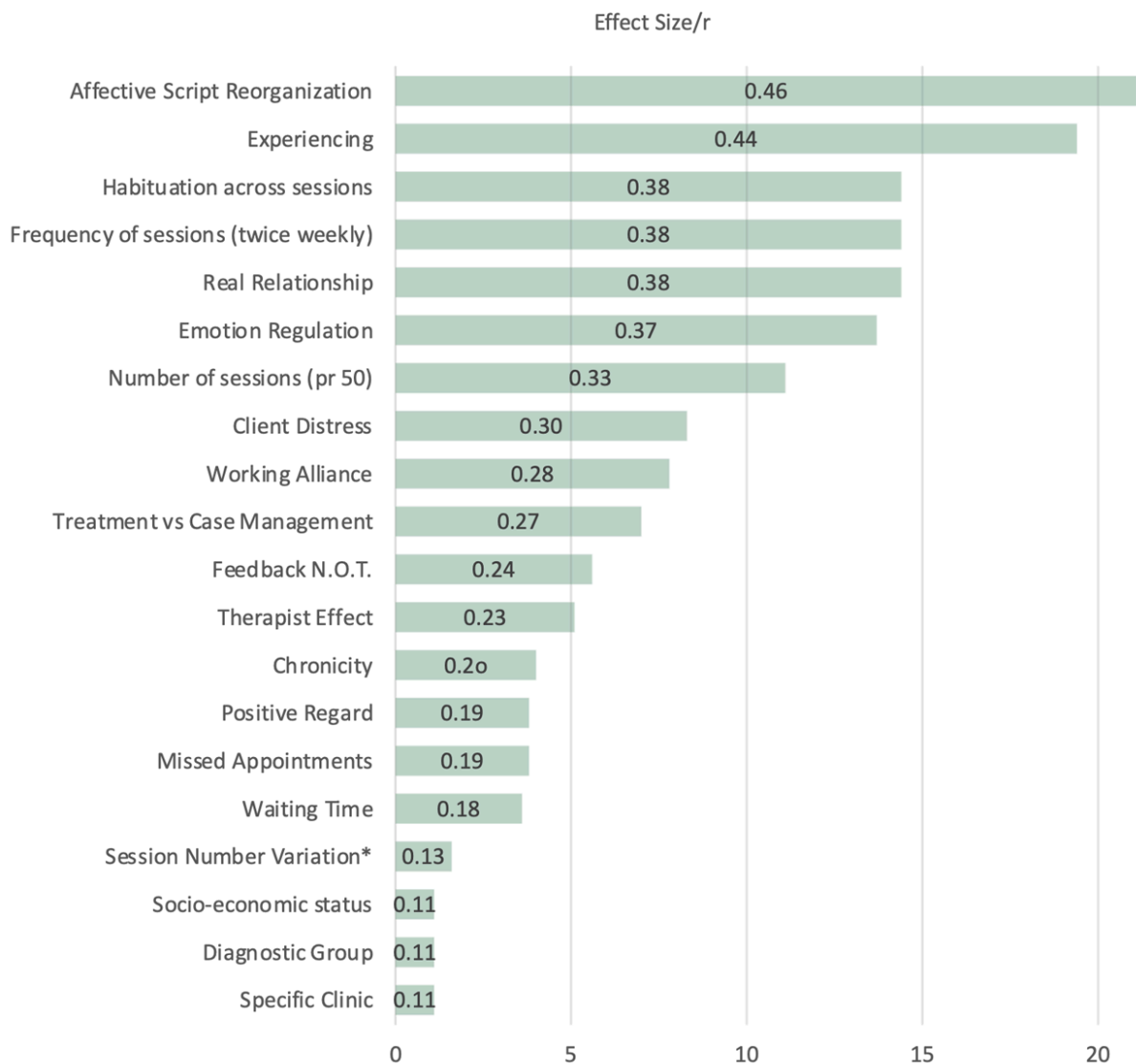
Figur 1. Effekten av ulike terapeutiske faktorer oppsummert

Merknad. Emosjonelle endringsprosesser som experiencing, frykthabituering og reorganisering av affektive script ser ut til å være blant de aller mest betydningsfulle endringsfaktorene i psykoterapi.